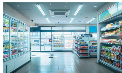
コンビニエンスストア