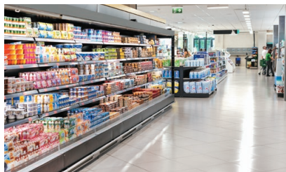
スーパーマーケット