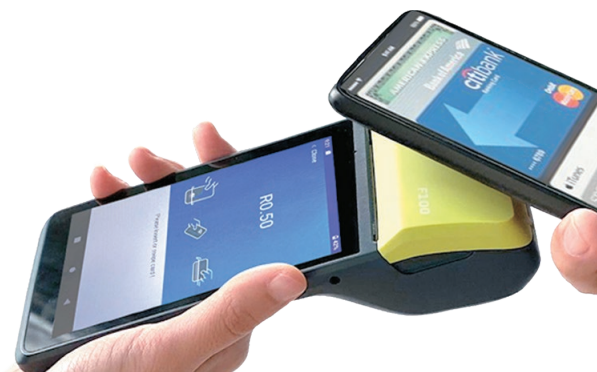
クレジットカード決済 (IC非接触)